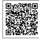
▲Pro CI YouTube

米国のコンサルティング会社Pro CI Consulting社は、世界有数のATMメーカーを対象とした「日本でのカスタマイズ型スタディプログラム(全4回)」の実施パートナーとして、当社並びに関連会社であるマリゴールドコンサルティングを選定。両社が保有する研修プログラムであるZenkai Improvement Partners(以下、Zenkai)を採用し、2025年より協業を開始しました。